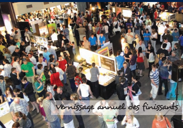
Vernissage annuel des finissants

Possibilité de poursuivre des études universitaires pour obtenir un baccalauréat en Génie de la construction