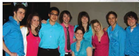
Quelques finissants de la cohorte 2009